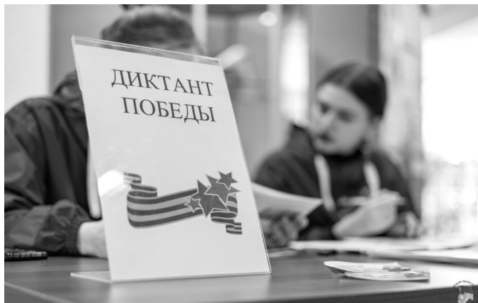
Международная историческая акция «Диктант Победы» прошла по инициативе партии «Единая Россия».

В этом году самый масштабный тест на знание истории Великой Отечественной войны состоялся в седьмой раз. Крупнейшая просветительская и патриотическая акция «Диктант Победы» открыла череду мероприятий, приуроченных к празднованию 80-летия Великой Победы.