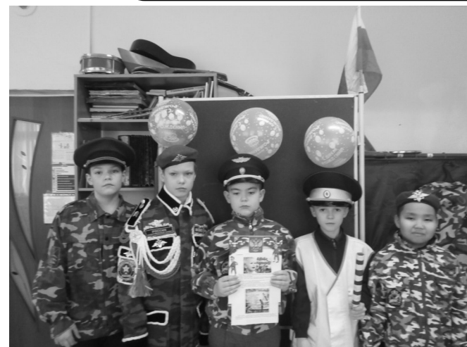
День сыновей – это праздник, который отмечает особую связь между отцами и сынами, подчеркивая важность семейных ценностей, взаимопонимания и патриотизма.

Праздник начался с официального открытия, на котором руководитель детского объединения выступила с приветственной речью. Она говорила о значении Дня сыновей и важности роли отцов в жизни своих сыновей, о том, как отцовская поддержка формирует характер и мировоззрение.