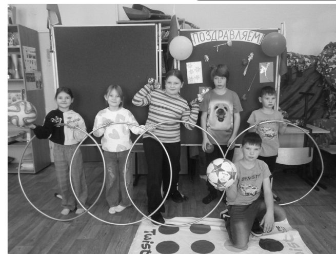
В преддверии праздника в детском объединении «Подвиг» прошли веселые спортивные соревнования, ставшие уже традиционными!

Соревнования прошли под девизом «Папам посвящается». Программа была довольно насыщенной. Командам были предложены интересные конкурсы с бегом, прыжками, эстафеты с мячами, кеглями и обручами, где они смогли проявить свои спортивные, умственные способности и навыки.