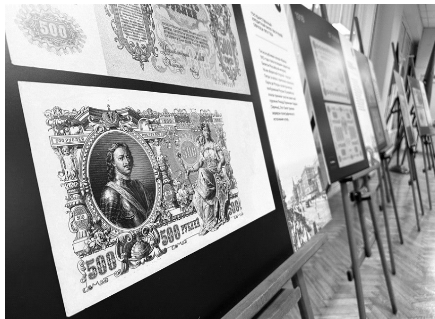
Фотовыставка банкнот «От купюр: история бумажных денег» открылась в Магаданской областной универсальной научной библиотеке имени А.С. Пушкина.

Вниманию посетителей представлены десять фотопанно с увеличенными изображениями банкнот из собрания Музея Банка России.