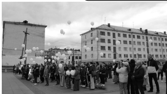
Митинг Памяти, посвященный окончанию Второй мировой войны и Дню солидарности в борьбе с терроризмом, прошел 3 сентября на площади районного центра досуга и народного творчества. Это дни, которые напоминают нам о мире, свободе и необходимости бороться с насилием и терроризмом.